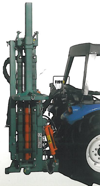
PIANTAPALI RETRO-LATERALE MOD. RAMBO RL